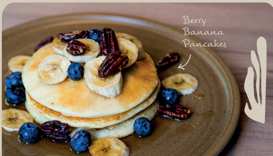
Berry Banana Pancakes